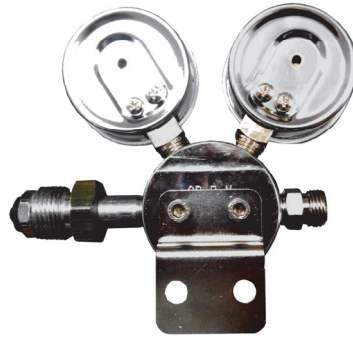
背面可加裝固定架