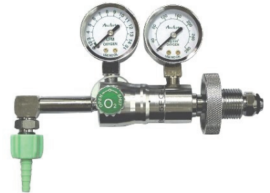
UB-107 (W22 銅六角螺帽-雙大錶)