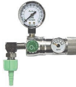
UB-103 (W22 鋁圓螺帽-單大錶)