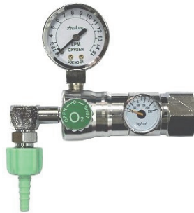
UB-102 (W22 銅六角螺帽-單大錶)