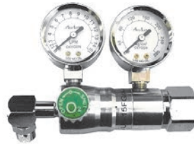
UB-106 (W22 銅六角螺帽-雙大錶)