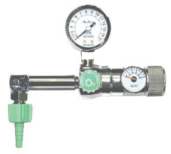
UB-104 (W22 鋁圓螺帽 加長型-單大錶)